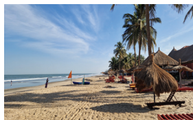
Slaveøya James Island