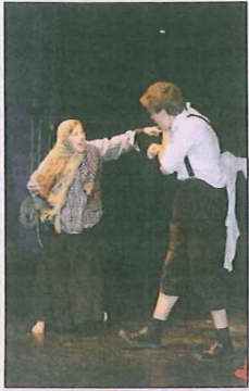
Kompani Linge med tankevekkende teater.