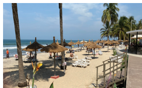
Slaveøya James Island